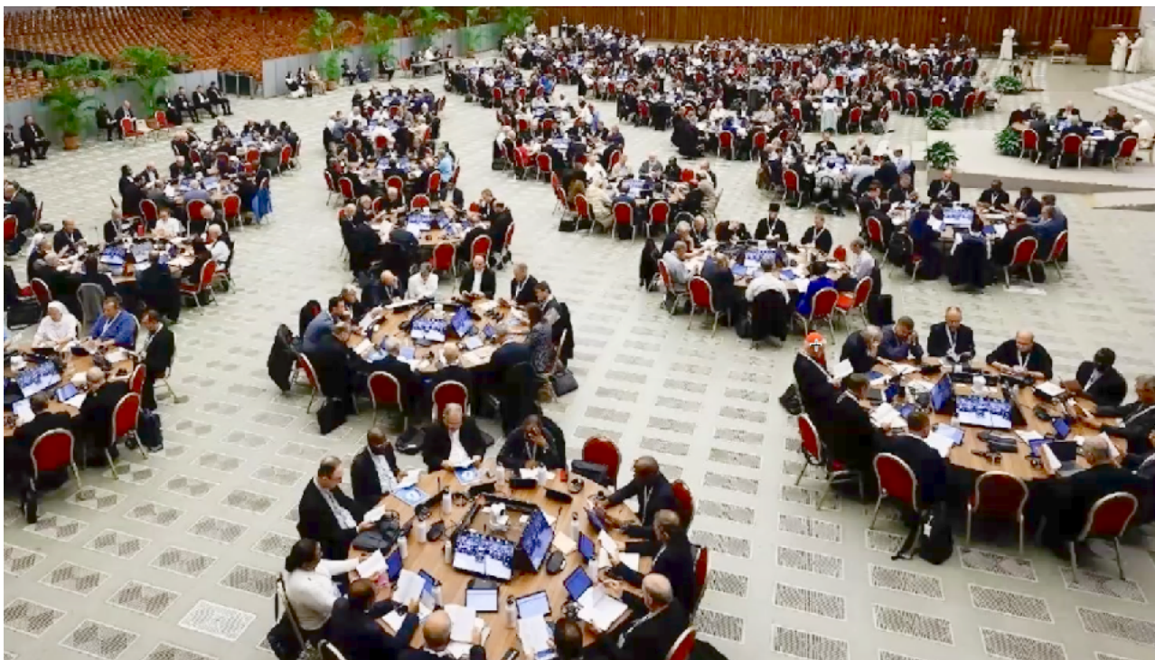
Séance du 4 octobre, le premier jour du Synode. Le pape est assis à la table en haut à droite

C'est beau: dans une situation difficile, c'est une femme qui invite les personnes autour de la table à revenir dans l'instant présent de leur relation.