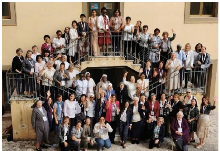
La soixantaine de femmes du synode

Il est important de pouvoir lire cet instant